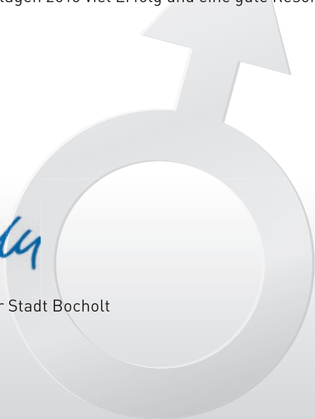
Peter Nebelo Bürgermeister der Stadt Bocholt